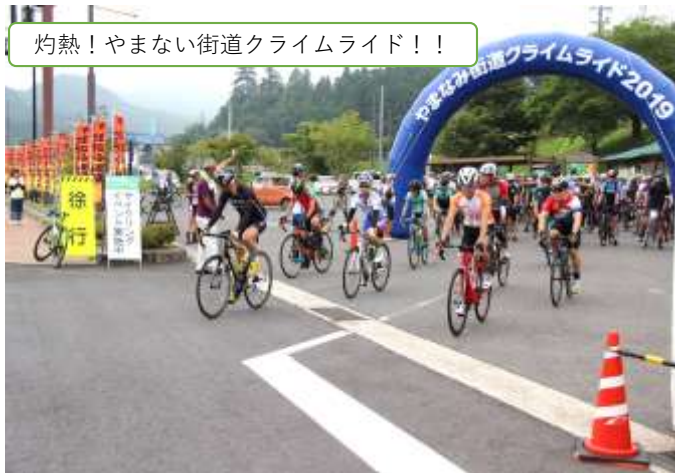
灼熱！やまない街道クライムライド！！