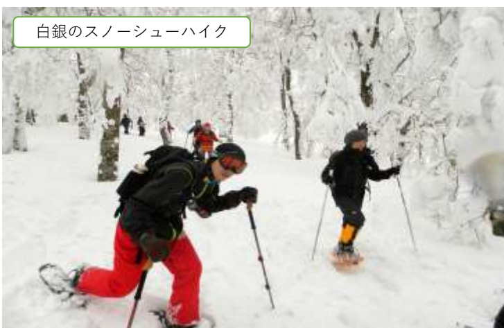
白銀のスノーシューハイク