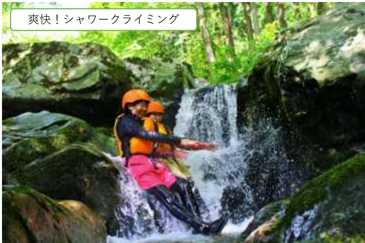
爽快！シャワークライミング