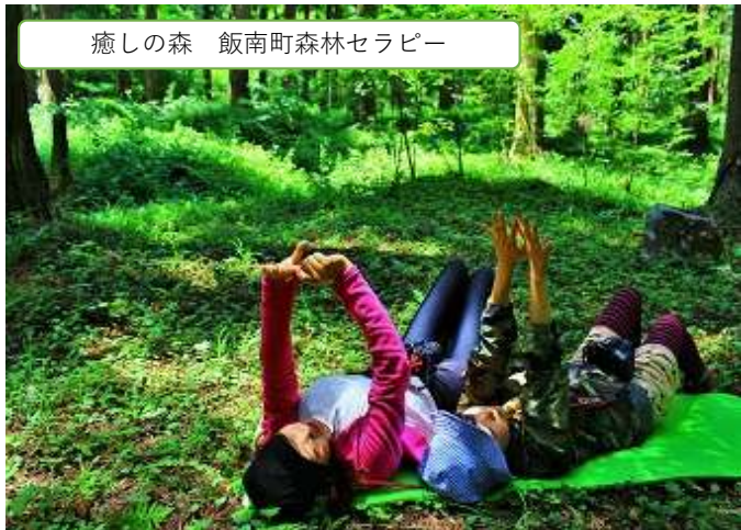
癒しの森 飯南町森林セラピー