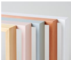
・廃材を利用した ワークショップ運営